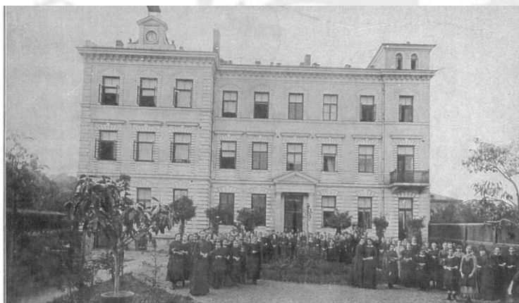
Żeńska szkoła hr. Cecylii Plater-Zyberkówny 1886 r

po 1945 r upaństwowienie szkół i zamiana na koedukacyjne