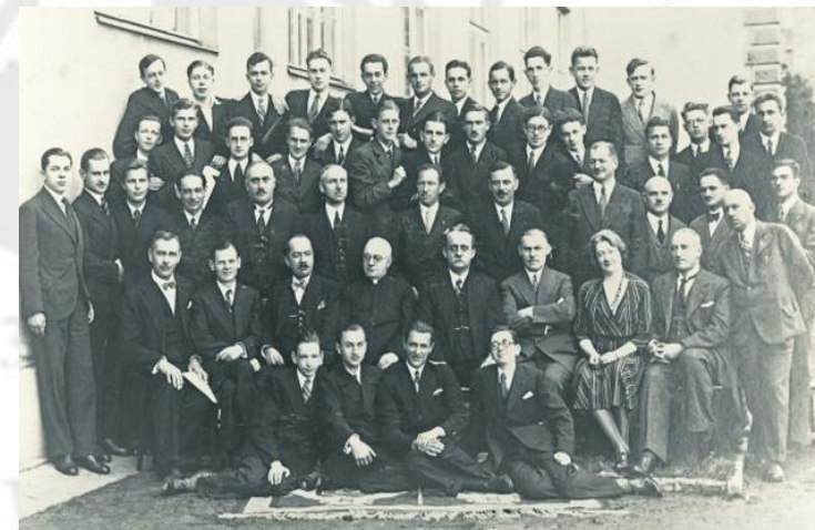
koedukacyjne Gimnazjum im. Stefana Batorego – matura 1933 r